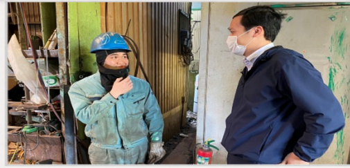
技能実習生との面談