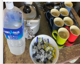
塩飴・スポーツドリンク

今年は残暑が続きます！暑さに慣れているベトナム人ですが、水分・塩分補給はしっかり行わせてください。